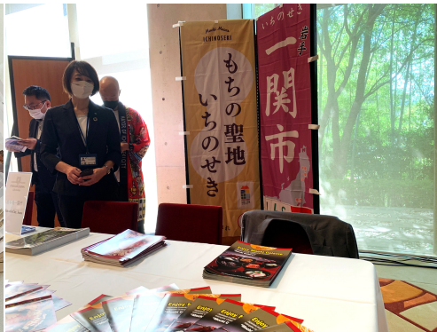
岩手県一関市ブース

また、このシステムに参画する地方自治体にとっても地元へのインバウンド誘致や地域創生にまつわる課題や悩みへ大きな足掛かりにもなる。同社は参画する自治体と体験「コト」コンテンツの商品造成の段階から関わり、各地域の特色を活かした「モノではないコト」商品の磨き上げと高付加価値な企画の商品化、そして「ふるさとジャパン」プラットフォームという販路までをワンストップで提供している。