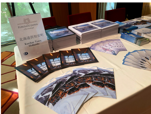
北海道倶知安町ブース

現在、日本国内には約300万人の在日外国人が居住している。うち40万人は駐在員など日本語が理解できない外国人だ。ラグジュアリーはこの在日外国人層に着目し、海外から派遣された外国人駐在員（エキスパッツ）がふるさと納税サービス「ふるさとジャパン」を利用することで、その後帰国した後に日本の良さを拡散する大切なインフルエンサーとなり、コロナ禍によって失った訪日人口、コロナ前に“観光立国日本”を目指していた訪日観光業の回復と底上げにも寄与できると考えている。