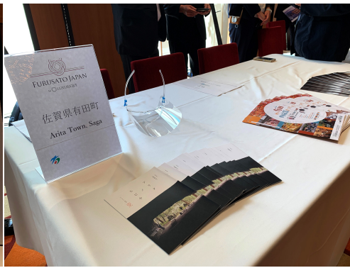
佐賀県有田町ブース