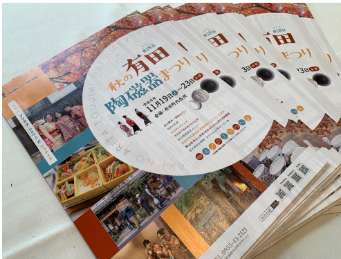
佐賀県有田町ブース