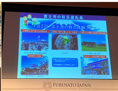
静岡県富士市プレゼンテーション